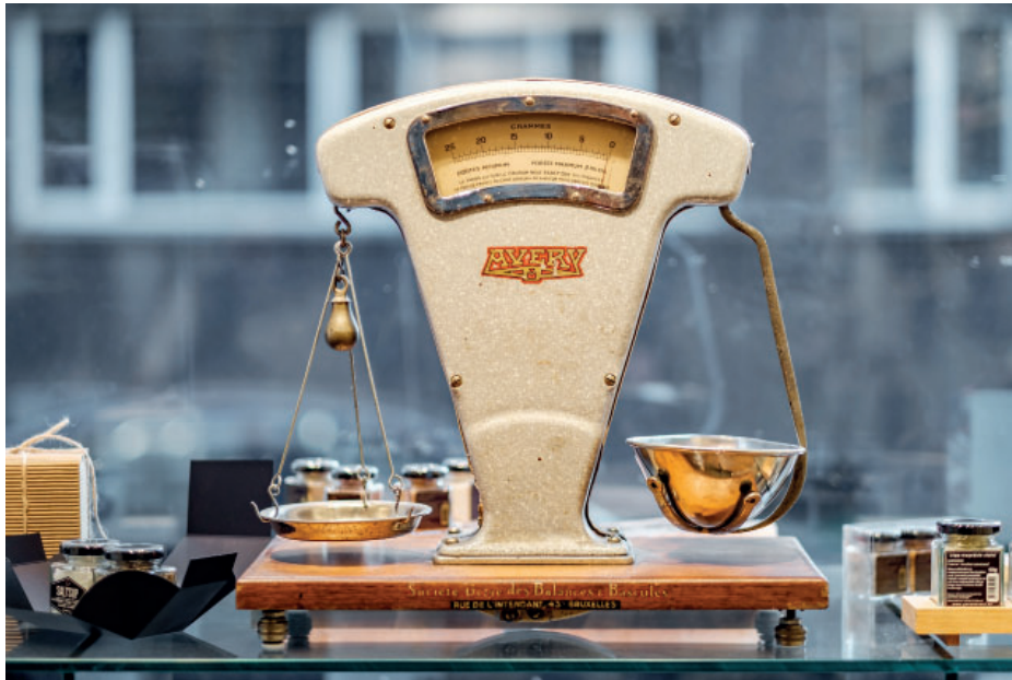
Balanç humanitat - natura

Estem inegablement lligats a la natura. Ens nodreix i manté vius. Si acabem amb ella, acabem amb nosaltres mateixes.